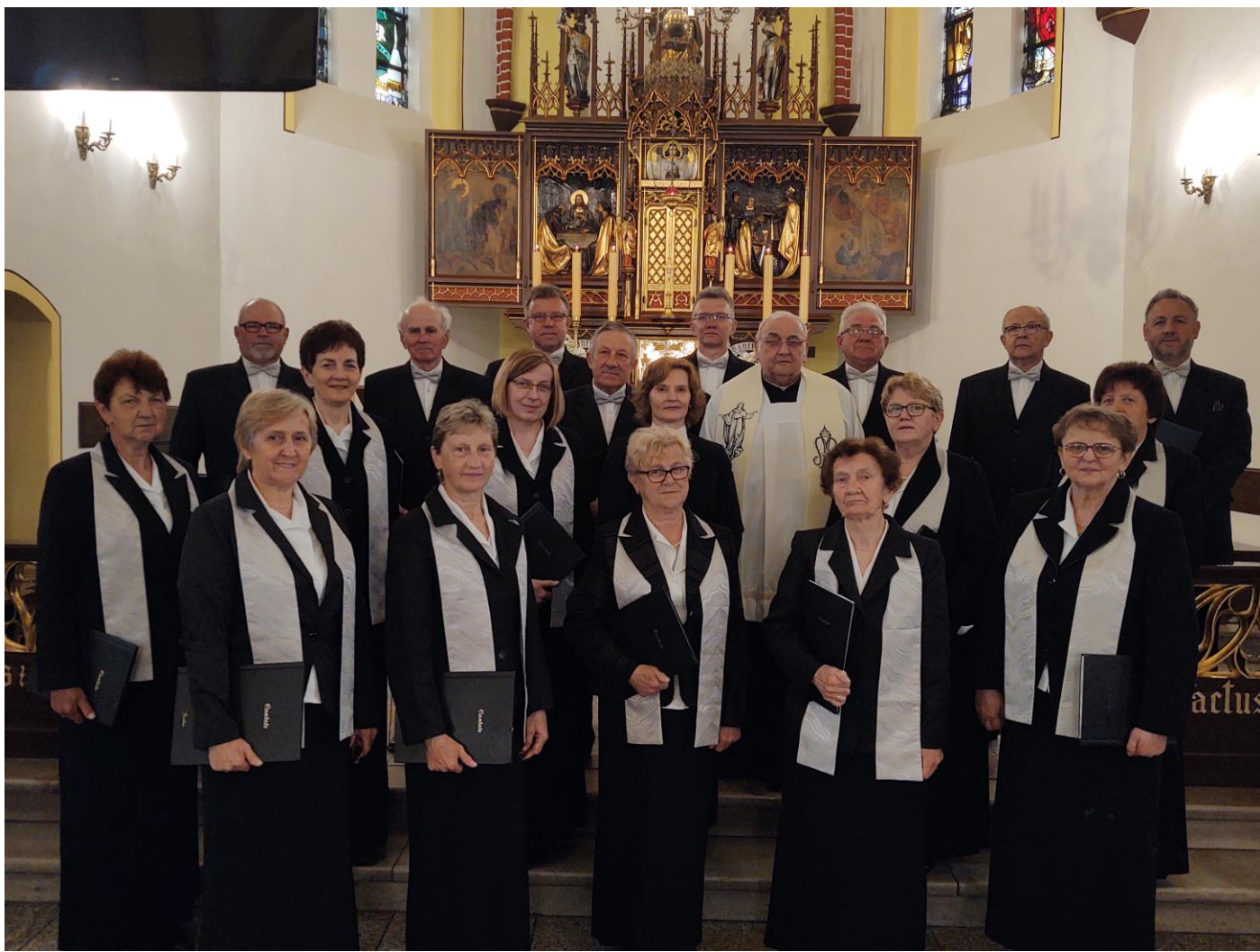
Chór CANTATE po występie w czasie nabożeństwa majowego – niedziela – 30 maja 2021