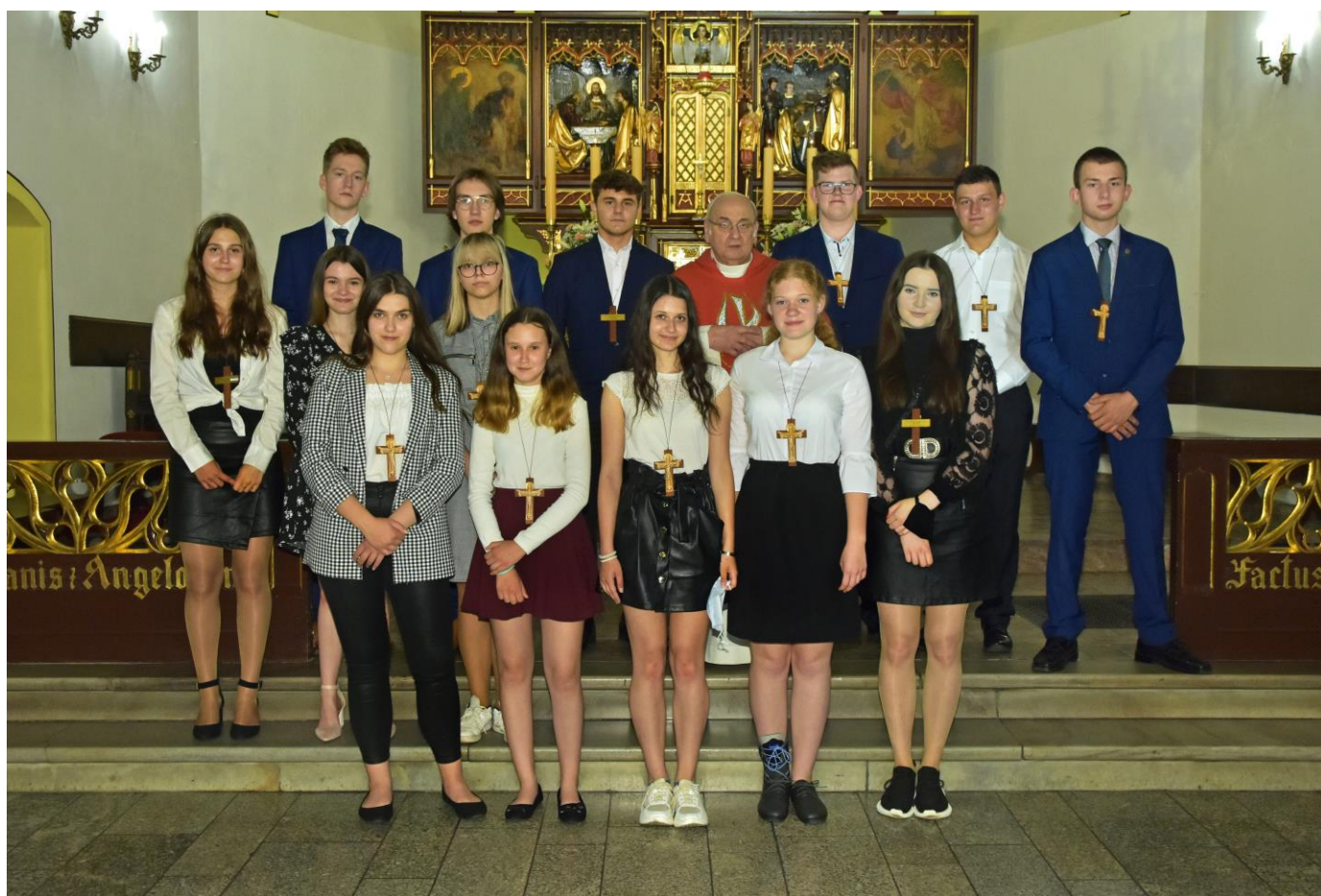
Bierzmowani 2021 – po Mszy św. dziękczynnej za Sakrament Bierzmowania – poniedziałek – 07/06/2021